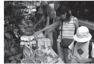
宮崎県日之影町特産品即売会も開催